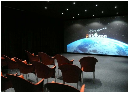
Kinosaal im Kinoton Technikzentrum

Nur wenige hundert Meter vom Stammhaus in Germering entfernt hat die Kinoton GmbH ihr neues Technikzentrum eröffnet. Modernste technische Ausstattung, zeitgemäße Präsentationstechnik und eine flexible Bestuhlung lassen eine vielfältige Nutzung zu. So dienen die neuen Räumlichkeiten als Schulungszentrum, Democenter und Showroom; außerdem eignen sie sich hervorragend, um neue Projektions- und Displaytechnologien zu testen. Die Kinoton teilt sich das Technikzentrum mit ihrer Partnerfirma DVC Digitalvideo Computing.