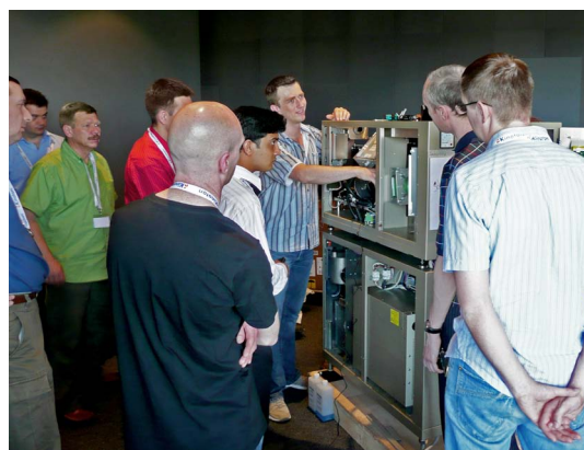
Praxischulung an einem DCP Digital Cinema Projektor