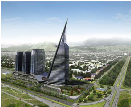
The Centaurus in Islamabad