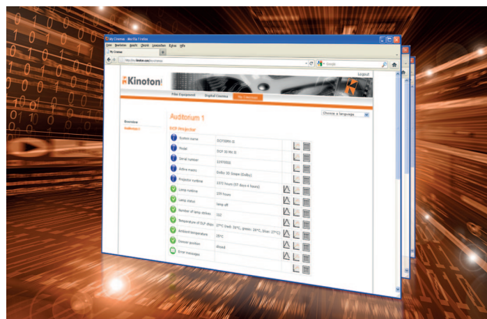
Kinoton Online-Zugriff auf „Meine Kinos“

Remote-Service-Kunden können den Status ihrer angeschlossenen D-Cinema-Geräte im Vorführraum jederzeit selbst kontrollieren, und zwar schnell und praktisch über das Internet. Mithilfe Ihrer persönlichen Zugangsdaten können Sie über unser neues, sicheres Online-Monitoringtool „Meine Kinos“ die wichtigsten Parameter Ihrer Geräte im Vorführraum überprüfen, wie etwa die Lampenlaufzeit, die Temperatur wichtiger Baugruppen im D-Cinema-Projektor, den Status der Festplatten des D-Cinema-Servers etc. Werte außerhalb des Toleranzbereichs oder Fehlermeldungen werden signalisiert. In diesem Fall kontaktieren Sie einfach unser Kinoton Cine Perfect Team, das dann sofort die Online-Fehlerdiagnose über die entsprechende KRS-Box durchführt. So können mögliche Fehlerquellen, wie eine alternde Lampe oder ein verschmutzter Lüfter, der eine Temperatursteigerung verursacht, rechtzeitig erkannt und behoben werden.