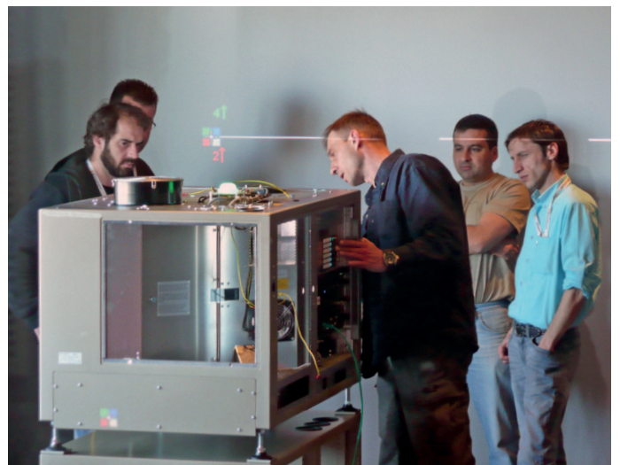
Original-Equipment sorgt bei Kinoton-Schulungen für den nötigen Praxisbezug

Kleine Lerngruppen, erfahrene Trainer und praktische Übungen an Original-Equipment stellen sicher, dass sich die Teilnehmer den Lernstoff vollständig verinnerlichen können. So kann sich der Kinobetreiber darauf verlassen, dass seine Mitarbeiter künftig fachkundig mit der neuen Technik umzugehen verstehen. Wartungskunden profitieren übrigens von günstigen Sonderkonditionen!