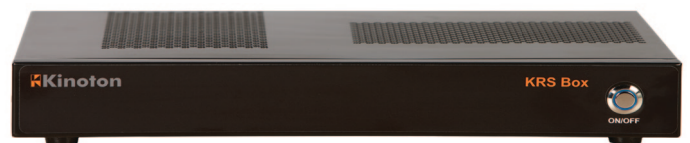
Kinoton KRS Box

Das Kinoton Remote Service (KRS) System ist im Servicefall das Zeitsparinstrument schlechthin. Neben der schnellen Fehlerdiagnose und ggf. auch Fehlerbehebung über das Internet hilft es auch Serviceeinsätze vor Ort zu beschleunigen. So können sich Kinoton-Servicetechniker über einen gesicherten, hochverfügbaren Zugang jederzeit wertvolle Hilfsmittel von der integrierten KRS-Technikerplattform herunterladen. Dazu gehören detaillierte Serviceanleitungen, Software und Firmware, die Kinoton-Wissensdatenbank sowie Service- und Wartungstools für Kinoton-Produkte und zu servicierende Fremdgeräte. Außerdem stellt die KRS-Plattform unseren Servicetechnikern alle wichtigen Standard-Konfigurationsdateien zur Verfügung, die das Setup neuer Geräte oder getauschter Komponenten beschleunigen. Auch häufig wiederkehrende Konfigurationseinstellungen kann der Techniker dort deponieren, um sie im Servicefall schnell zur Hand zu haben. Individuelle Konfigurationsdaten der Geräte im Bildwerferraum werden direkt auf der KRS-Box hinterlegt. Im Störfall kann der ausführende Kinoton-Techniker damit jedes Gerät in kürzester Zeit wiederherstellen, egal, welcher seiner Kollegen es bei der Ersteinstallation konfiguriert hatte – die KRS-Box weist ihm quasi den Weg.