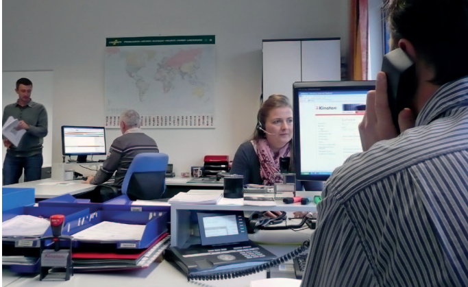
Technischer Service bei Kinoton

Im Störfall zählt jede Minute! Der Servicepartner sollte daher während der Kinobetriebszeiten jederzeit schnell erreichbar sein und ein schnelles Feedback garantieren. Die Service-Hotline muss mit erfahrenen Kinotechnikern besetzt sein, die sofort gezielt „Erste Hilfe“ leisten können. Gerade beim digitalen Kino ist zudem ein Remote Service System von Vorteil, das eine sofortige individuelle Online-Fehleranalyse ermöglicht. Lässt sich die Störung nicht durch telefonische Beratung oder per Fernwartung beheben, muss ein qualifizierter Servicetechniker in kürzester Zeit und mit allen erforderlichen Ersatzteilen vor Ort sein können. Ein engmaschiges Netz an Servicestützpunkten, die kurze Anfahrtswege gewährleisten, ist also ebenfalls Pflicht.