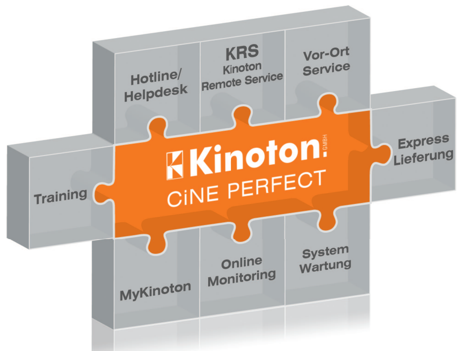
Kinoton Cine Perfect: umfassender Service und Support aus einer Hand

Manche Servicedienstleister beschränken ihren Support nur auf ihre Eigenprodukte. Anfragen zu Fremdfabrikaten leiten sie im besten Fall an den jeweiligen Hersteller weiter, was für zusätzliche Verzögerungen sorgt. Im schlimmsten Fall muss sich der Kunde selbst durch verschiedene Hotlines und Helpdesks kämpfen, um den richtigen Ansprechpartner für sein technisches Problem zu finden. Ein qualifizierter Service und Support für Filmtheater dagegen muss jegliches Kinotechnikproblem eines Kunden zu seinem eigenen machen und sich entsprechend konsequent um eine schnelle und nachhaltige Lösung bemühen.