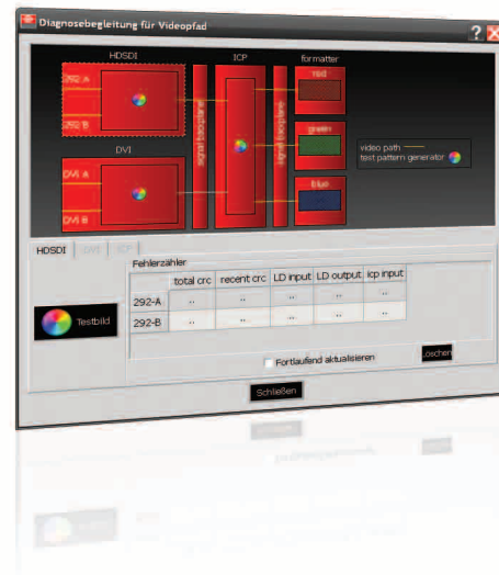
Communicator Software: Testbildgenerator zur schnellen Diagnose von Bildfehlern.

Die Kinoton GmbH bietet hier mit ihrem umfassenden, flächendeckenden Servicekonzept einen unübertroffenen guten Support, der so manche Vorstellung retten kann. Näheres können Sie in der Ausgabe 8 der „Kinoton informiert“ nachlesen, die Sie auf der Internetseite www.kinoton.de/news/kinoton-informiert.html finden.