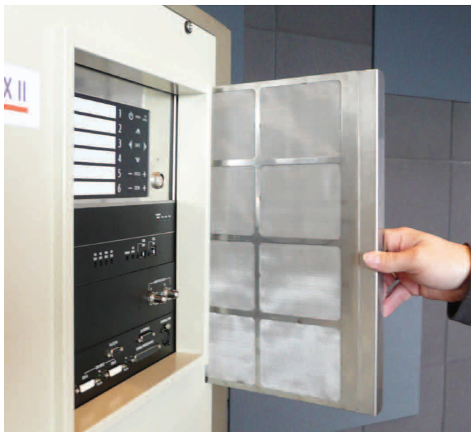
Einfache Entnahme des Metall-Luftfilters bei einem DCP II Projektor

Einweg-Luftfilter, die in regelmäßigen Abständen ersetzt werden müssen, gehen auf die Dauer ins Geld. Kostensparender sind wiederverwendbare Luftfilter aus Edelstahl-Feingewebe. Sie müssen lediglich ausgeblasen werden und sind dann sofort wieder einsatzfähig. Etwaige fettige Verschmutzungen lassen sich durch eine Nassreinigung entfernen. Ideal ist es, wenn die Metallfilter, wie bei den DCP II Projektoren, von außen zugänglich sind. So können sie vom Vorführer bequem entnommen und gereinigt werden, und der Projektor ist auch ohne den Besuch eines Servicetechnikers schnell wieder spielbereit.