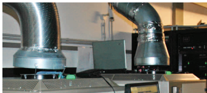
Abluftanlage an DCP II Projektoren

Dafür reicht die bestehende Lüftungsanlage im Allgemeinen problemlos aus, so dass nicht nur die teure Aufrüstung der Anlage entfallen kann, sondern auch der entsprechende Stromverbrauch im gewohnten Bereich bleibt.