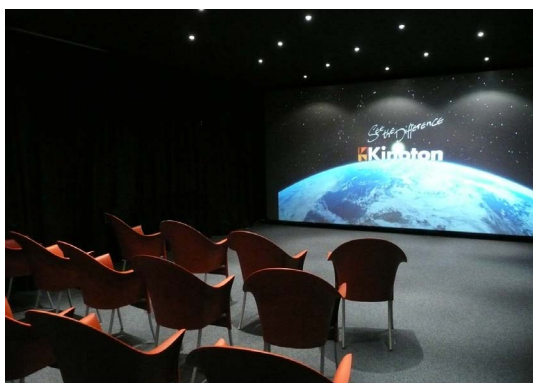
Kinosaal im Kinoton Technikzentrum

Nur wenige hundert Meter vom Stammhaus in Germering entfernt hat die Kinoton GmbH ihr neues Technikzentrum eröffnet. Modernste technische Ausstattung, zeitgemäße Präsentationstechnik und eine flexible Bestuhlung lassen eine vielfältige Nutzung zu. So dienen die neuen Räumlichkeiten als Schulungszentrum, Democenter und Showroom; außerdem eignen sie sich hervorragend, um neue Projektions- und Displaytechnologien zu testen. Die Kinoton teilt sich das Technikzentrum mit ihrer Partnerfirma DVC Digitalvideo Computing.